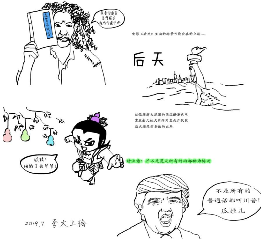
图2:《老布侃大神》系列手绘作品中部分人物表情及动作

手绘作品中的人物表情和动作可以适当地夸张一些,使之具有一定的“喜剧”色彩,语言最好能够生动轻快并符合时下的“流行语”。这样更容易让读者有一个轻松愉快的阅读环境。适当地也借鉴了影视作品和文学作品中的某些人物形象和用语。